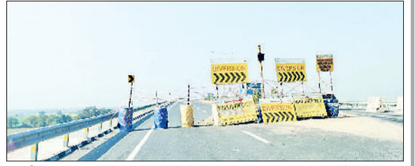
रेवाड़ी। आउटर बाईपास का बंद किया गया हिस्सा।

बाईपास रोड के एक हिस्से को बंद करने के बाद पुल में आवश्यक तकनीकी सुधार का कार्य जल्द शुरू किया जा रहा है। इसके बावजूद इस कार्य को पूरा होने में लगभग एक माह तक का समय लग सकता है। चूंकि दिसंबर माह में किसी भी कोहरा शुरू हो सकता है, इसलिए मारी कोहरे के दौरान एक तरफा रोड बंद होने से हादसों की आशंका बनी रहेगी। इसके लिए एनएचआई ने सुरक्षा की दृष्टि से आवश्यक सांकेतिक निशान भी रैडियम से बनाने शुरू कर दिए हैं।