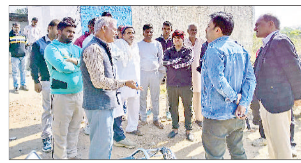
निजामपुर। बिजली की बाधित सप्लाई से परेशान ग्रामीण कनिष्ठ अभियंता को ज्ञापन देते हुए।