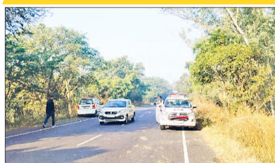
रेवाड़ी। हादसे के बाद मौके पर पहुंची पुलिस की ईआरवी।