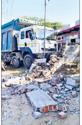
नांगल चौधरी। अनियंत्रित डंपर की टक्कर से गिरी मकान की दीवार।

बताया कि मूसनोता के पास पहाड़ पर बीते दशक से अवैध खनन हो रहा है तथा क्रैशर स्थापित हो गए, जहां पत्थरों की पिसाई होने लगी है। पत्थर सप्लाई के लिए रोजाना 700 से 800 डंपरों का संचालन हो रहा है। जिनके चालक जल्दी चक्कर लगाने की होड़ में तेज रफ्तार से दौड़ाते हैं। शुक्रवार की सुबह करीब पांच बजे ग्रामीण सोए हुए थे। इसी दौरान एक डंपर आवासीय मकान की दीवार से टकरा गया। टक्कर इतनी तेज थी कि पूरी दीवार क्षतिग्रस्त हो गई। इस दौरान परिजन सोए हुए थे, टक्कर की आवाज सुनकर बाहर निकले। इस दौरान पूरी दीवार गिरी हुई थी।