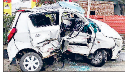
कनीना। हादसे के बाद मौके पर खड़ी क्षतिग्रस्त कार।