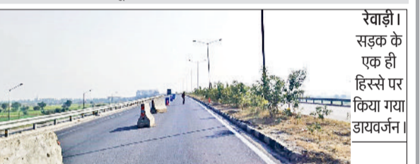
रेवाड़ी। सड़क के एक ही हिस्से पर किया गया डायवर्जन।

दिल्ली-जयपुर नेशनल हाइवे से जैसलमेर की ओर जाने वाले हिस्से का आवागमन एनएचआई ने शुक्रवार को बंद कर दिया है। दोनों हिस्सों का दृष्टिक जैसलमेर से जयपुर नेशनल हाइवे की ओर जाने वाले हिस्से से ही शुरू किया गया है। रोड के बीच में प्लास्टिक झुम व अवरोधक लगाकर अस्थायी डिवाइडर बनाया गया है। इससे इस रोड पर वाहनों की रफ्तार मंद पड़ गई है। ओवरब्रिज पर कोई भारी वाहन खराब होने की सूत्रत में जमा की समस्या तक का सामना करना पड़ेगा।