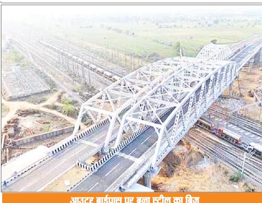
आउटर बाईपास पर बना स्टील का ब्रिज

चालू होने में लग सकता है एक माह, बाईपास के एक ही हिस्से से यातायात का आवागमन